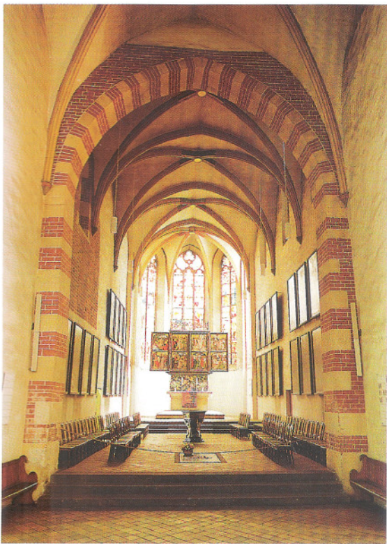
Santa Maria Kirche, Mulhausen